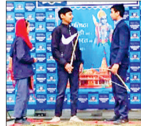
महेन्द्रगढ़। कार्यक्रम में अपनी प्रस्तुति देते विद्यार्थी।

बुंदेबाज नगर स्थित गुरुकुलम इंटरनेशनल स्कूल में सोमवार को अयोध्या मंदिर की प्राण प्रतिष्ठा पर एक मनमोहक कार्यक्रम आयोजित किया गया, जिसमें बच्चों ने बह-चढ़कर भाग लिया। बच्चों ने विभिन्न प्रकार के सांस्कृतिक कार्यक्रम के द्वारा पूरा वातावरण राममय बना दिया। भगवान राम के जीवन पर भव्य नाटिका प्रस्तुत की गई। इस दौरान रामायण से संबंधित प्रश्नोत्तरी कार्यक्रम भी किया गया, जिसमें बच्चों की जानकारी व उत्साह दोनों ही बढ़ोतरी हुई। इस कार्यक्रम से बच्चों ने अपनी अमूल्य