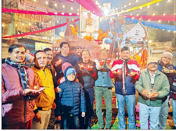
नारनौल। दीप उत्सव कार्यक्रम में भाग लेते हुए।

आजाद चौक युवा संगठन की ओर से रविवार रात को आजाद चौक प्रांगण में भगवान राम की अयोध्या में प्राण प्रतिष्ठा से पूर्व 1100 दीपक जलाए तथा आजाद