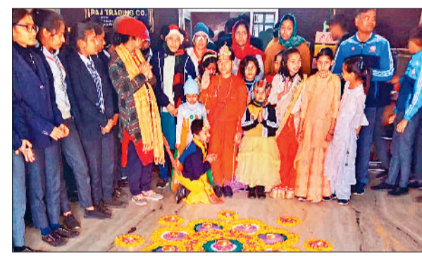
महेन्द्रगढ़। विद्यालय में दीये जलाते स्टाफ सदस्य।