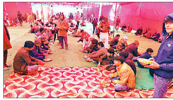
नारनौल। खातौली अहीर में आयोजित भंडारे में प्रसाद ग्रहण करते श्रद्धालु।