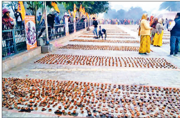
महेन्द्रगढ़। चौधरी रणबीर सिंह हुड़ा पार्क में लगाए गए दीपक।

अयोध्या में भगवान राम की मूर्ति प्राण-प्रतिष्ठा होने पर सोमवार को क्षेत्र पूरा राममय नजर आया। कहीं हवन-यज्ञ तो कहीं भंडारे लगाए गए। शहर के कुछ दुकानदारों ने बाजार में पूरे दिन देसी घी का हलवा, सब्जी पूरी व खीर का प्रसाद श्रद्धालुओं को वितरित किया। इसके अलावा युवाओं की टोलियों ने डीजे की धुन पर जय श्रीराम के नारों के साथ शहर में यात्रा निकालकर माहौल को राममय बना दिया। इसके अलावा शहर के विभिन्न जगहों पर हवन-यज्ञ किया गया। रणबीर सिंह हुड़ा पार्क में एक लाख से अधिक दीपक जलाए गए। जिसमें हजारों की संख्या में श्रद्धालुओं ने हिस्सा लेकर जय श्रीराम के नारे लगाकर दीपक जलाए गए। इसके अतिरिक्त युवाओं पार्क में जमकर आतिशबाजी भी की। इसके अलावा लोगों ने अपने घरों व प्रतिष्ठानों में रात्रि को दीपक जलाए गए। इसके अलावा राम भक्तों ने सुबह से ही मंदिरों में भगवान की आरती की गई।