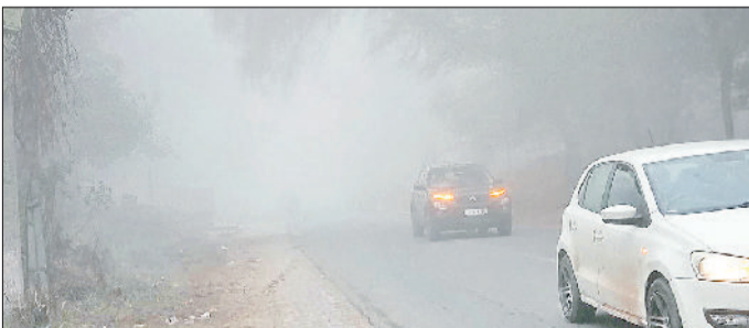
नारनौल। कोहरे ने रोकी वाहनों की रफ्तार।

हरियाणा एनसीआर दिल्ली विशेषकर जिला महेंद्रगढ़ में हाइ कंपा देने वाली ठंड का प्रकोप जारी है। वहीं जिले में लगातार शीतलहर व कोहरा ने कहर बरपाया हुआ है। जिससे आमजन को लगातार ठिठुरन भरी कड़ाके की ठंड से रूबरू होना पड़ उपांत जीआरपी मौके पर पहुंची तथा हरियाणा एनसीआर दिल्ली विशेषकर जिला महेंद्रगढ़ पर रिकॉर्ड तोड़ ठंड की चरम स्थितियां बनी हुई हैं। सम्पूर्ण इलाके पर वातावरण की ऊपरी और निचले स्तर पर कोहरा की सघन सफेद चादर, शीत दिवस, गंभीर शीतलहर अपने तीखे तेवरों