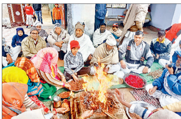
नारनौल। कोथल खुर्द में हवन करते हुए।