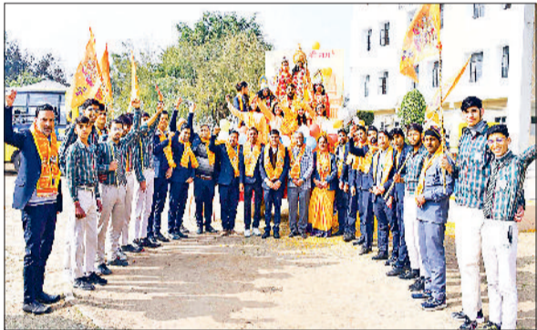
नारनौल। कार्यक्रम में भाग लेते बच्चे।