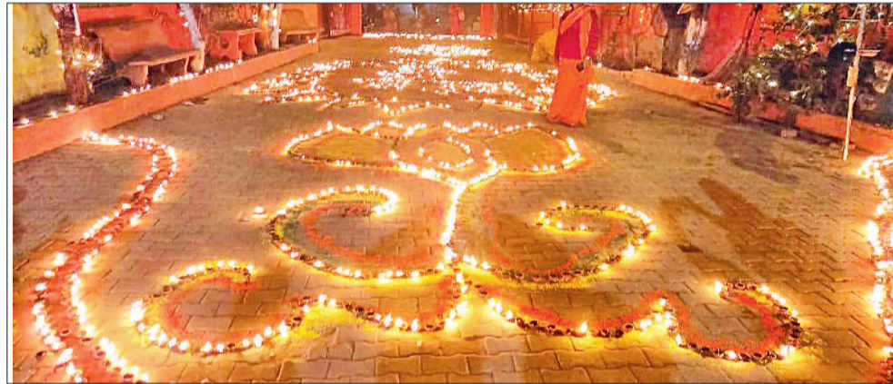
नारनौल। कड़िया वाले हनुमान मंदिर में दिए के उजाले से बनाई गई रंगोली और नारनौल शहर में बाइक रैली निकालते हुए।

अयोध्या में बनाए गए भव्य मंदिर में श्रीराम लला मूर्ति की प्राण प्रतिष्ठा सोमवार को हो गई। इस ऐतिहासिक क्षण को लोगों ने सोशल मीडिया के अलग-अलग माध्यमों से देखा और साक्षी बने। इसी खुशी को अपने-अपने अंदाज में जिला के लोगों ने मनाया। ठंड के बीच दिनभर त्यौहारी की सीजन का माहौल दिखाई दिया। श्रीराम के जयकारों की गूंज सुनाई दी। कहीं भंडारा तो कहीं हवन यज्ञ का सिलसिला चला। मंदिरों की साफ-सफाई कर लाइटों से जगमग किया गया। शाम होते-होते मिट्टी के दीप से मंदिरों, प्रतिष्ठानों व घरों में उजाला किया गया। मानो ऐसा लग रहा हो जिला पूरी तरह दीपावलीमय हो रहा हो। नारनौल शहर की बात करें तो आजाद