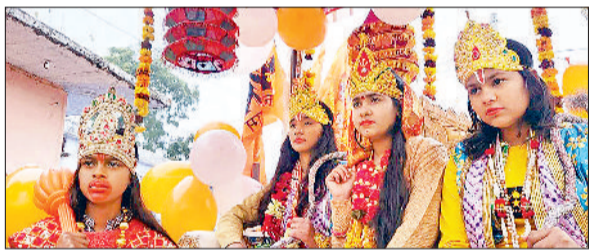
नारनौल। अयोध्या में श्रीराम मूर्ति की प्राण प्रतिष्ठा के अवसर पर गांव रामबास में खुशी, आस्था एवं श्रद्धा का माहौल बना रहा। लोग जय श्रीराम जय श्रीराम के नारे लगा रहे थे। इस अवसर पर गांव में झांकियों का आयोजन किया तथा प्रसाद वितरण किया गया। इस मौके पर गांव की महिलाएं, बुजुर्गों नौजवान साथी आदि मौजूद रहे। सभी ने इस झांकी में प्रभु श्रीराम की आराधना की और जय श्रीराम के नारे लगाए।