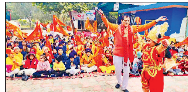
नारनौल। राम की प्राण प्रतिष्ठा पर नारनौल में शोभायात्रा में झूमते श्रद्धालु।