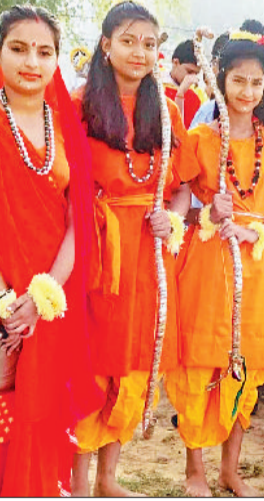
नारनौल। राम की प्राण प्रतिष्ठा पर नारनौल में शोभायात्रा में झूमते श्रद्धालु।